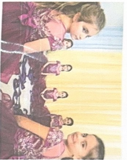
Танец РОМАШКОВАЯ РЕКА

Планила школьница, Крежиться, как земля, Ночью уроки, Далеко дружеской торопливо. У начальной школе Земля учимся, друзья. Иногда нашей ждем немерливо.